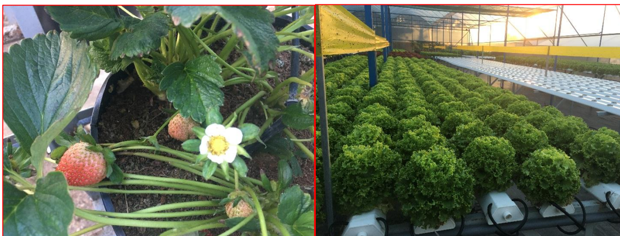
Đoàn tham quan các mô hình nông nghiệp tiên tiến tại TP Đà Lạt.

Ngoài tham gia tại cuộc thi, đoàn CB – GV và HS còn được tham quan nhiều địa điểm lý tưởng, mang nét đặc trưng của Thành phố sương mù.